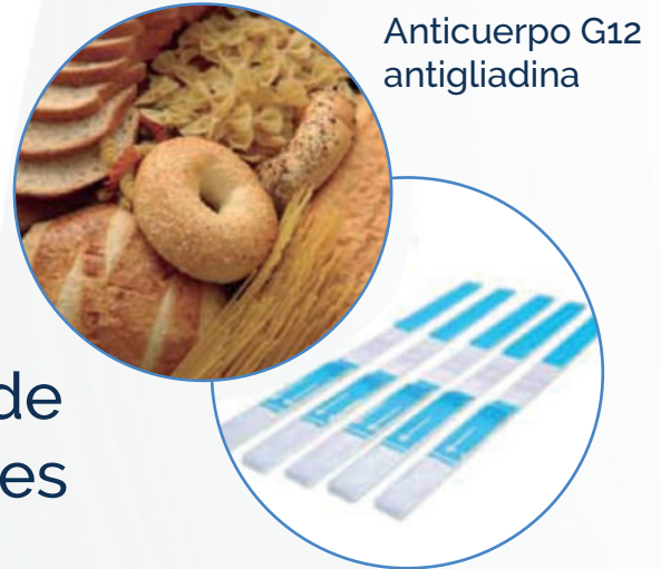
Anticuerpo G12 antigliadina