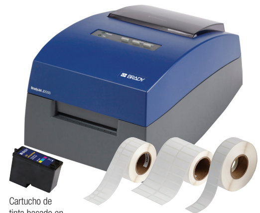
Cartucho de tinta basado en pigmentos CMY para la impresora J2000