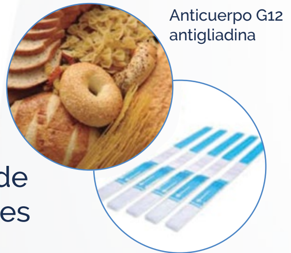
Anticuerpo G12 antigliadina